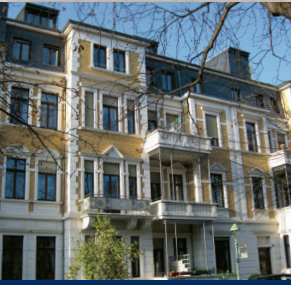
Poppelsdorfer Allee 50-52

Zentral im eleganten Bonner Zentrum gelegen